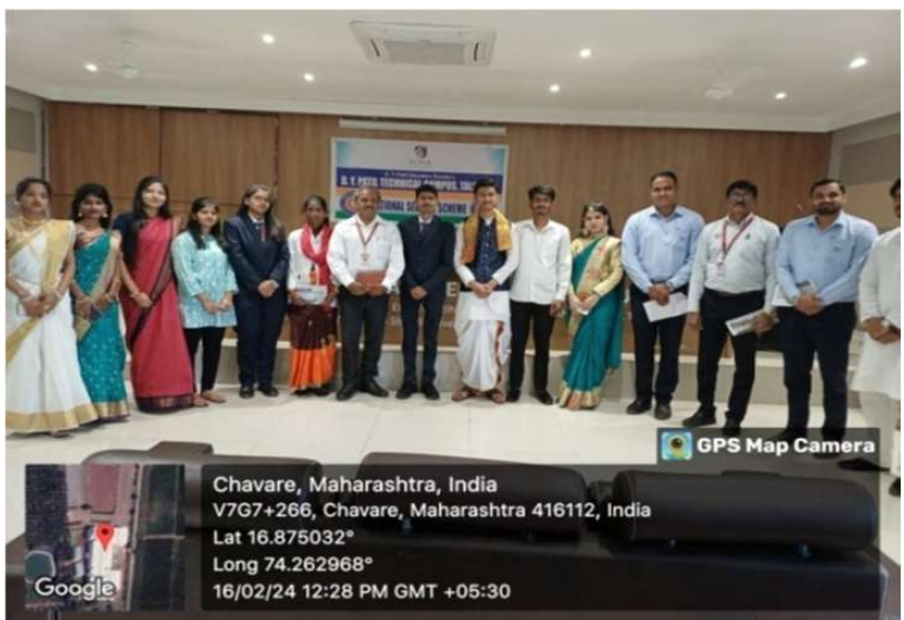
Guest Lecture on topic "Need organ donation and its importance"